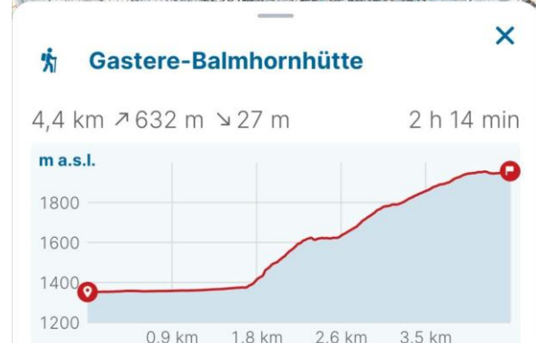
Abbildung 3 Der Wanderweg von Gastereholz.

Kurz nach dem Einbiegen ins Gasteretal befindet sich der Parkplatz auf der anderen Seite der ersten Kanderbrücke beim P. 1352. Es ist für Hüttengäste nicht erlaubt, beim Hotel Waldhaus oder im Gastereholz zu parkieren.