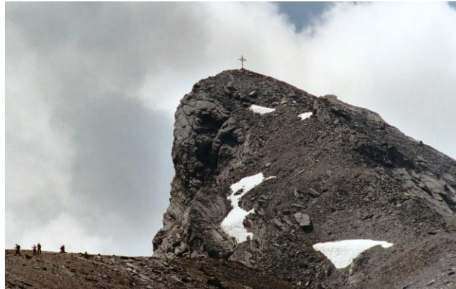
Abbildung 4 Gasterespitz

Für geübte Bergsteiger bietet sich die Besteigung des Balmhorns/Altels über den Wildelsige-Grat oder durch die Nordwand an. Beide Routen gel- ten als klassische Hochtouren für gute Alpinisten. Die Touren sind im Clubführer "Berner Alpen 5 " des Schweizerischen Alpenklubs, im SAC Tourenportal oder im SAC-CAS APP ausführlich beschrieben.