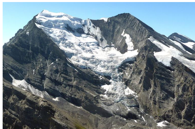
Abbildung 5 Nordwand des Balmhorns