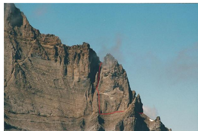
Abbildung 6 Wildelsigegrat