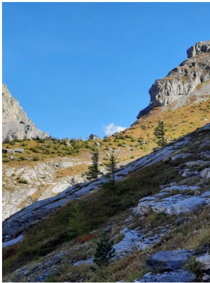
Abbildung 2 Lage der Hütte