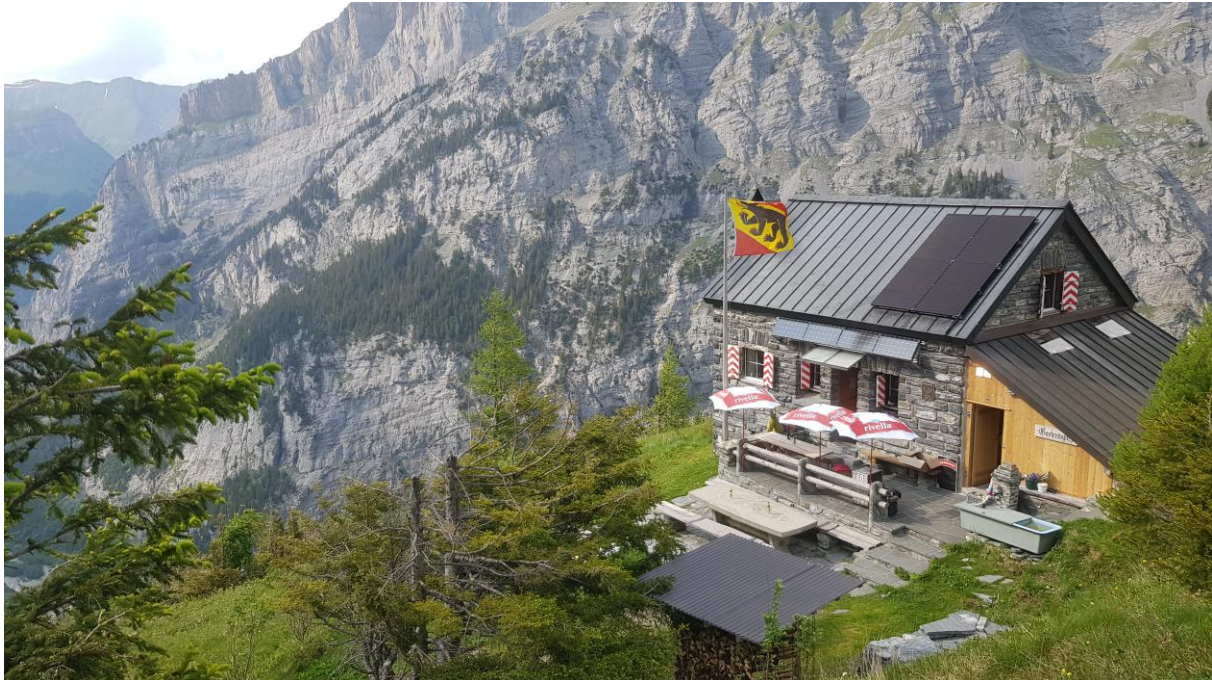
Abbildung 1 Balmhornhütte SAC

Die Balmhornhütte auf 1956 m ü. M. eignet sich sehr gut als Tagesziel und ist auch Ausgangspunkt für schöne Touren. Ein Aufenthalt, mit oder ohne Übernachtung, in dieser prachtvollen und stillen Umgebung bleibt ein unvergessliches Erlebnis.